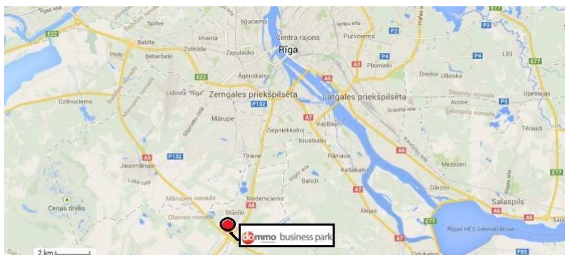
AB „INVL Baltic Real Estate“ įmonių grupės nekilnojamojo turto objektai Rygoje