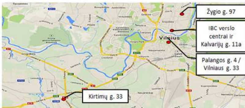
AB „INVL Baltic Real Estate“ įmonių grupės nekilnojamojo turto objektai Vilniuje